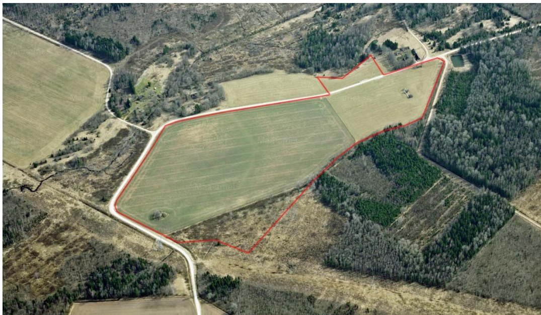
Planeeringuala asukoht markeeritud ligilähedaselt.

Planeeringuala asub Viljandi vallas Kiini külas katastriüksustel 62902:002:0051 (Küünipõllu), 62902:002:0049 (Küüni-Hansu), 62902:002:0362 (Songa) ja 62902:002:0361 (Songa). (Joonis 1). Planeeringuala suurus on ligikaudu 19 ha ning määratud omavalitsuse poolt detailplaneeringu algatamise otsusega. Varem koostatud detailplaneeringud sellel ja selle alaga piirneval alal puuduvad.